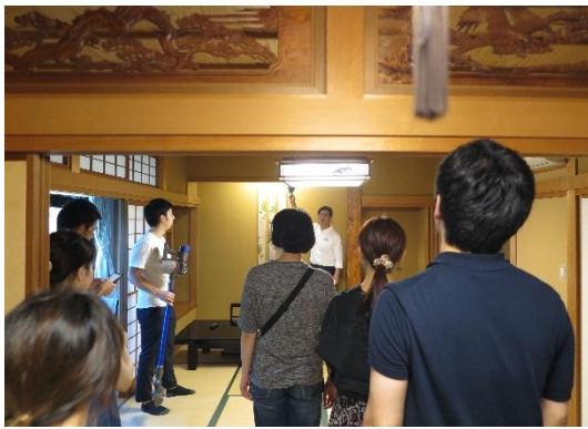
▲清掃方法を学ぶ様子

株式会社宿泊予約経営研究所（所在地：神奈川県横浜市）は、2018年7月より同社社員を対象に、旅館運営を学ぶための体験型研修を開始しました。